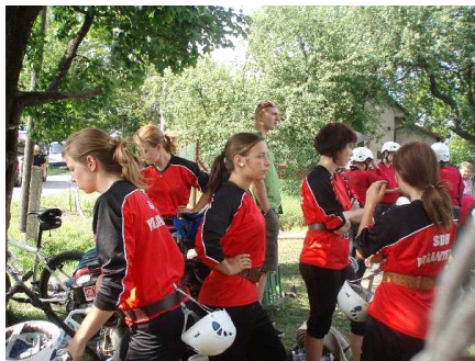
24. 6. Němetice: ženy – 10. místo