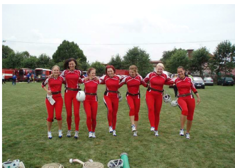
21. 7. Poruba: ženy – 5. místo