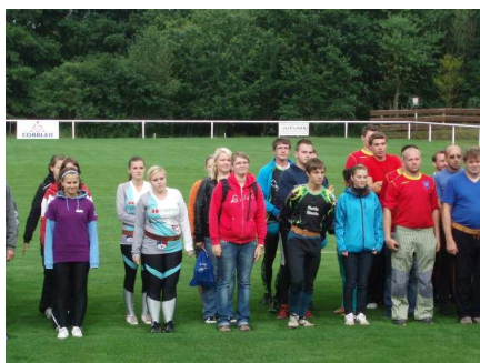
21. 7. Střítež: ženy – 5. místo