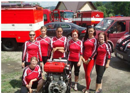
8. 7. Karolinka: ženy – 11. místo