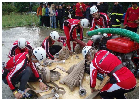
14. 7. Velké Karlovice: ženy – 3. místo