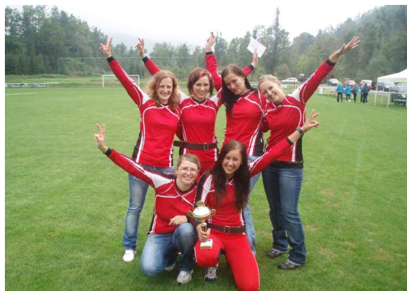
1. 9. Hutisko-Solanec: ženy – 1. místo

Není to však jen motor a jeho obsah, je to úprava čerpadla pro takový výkon, což ve finále znamená částku 120 až 150 tisíc. Tato částka není v rozpočtu SDH zrovna zanedbatelná, ale pevně věříme, že ve spolupráci se sponzory a obcí Vigantice se nám tato záležitost podaří vyřešit, abychom na jaře mohli mít nové srdce v podobě nové stříkačky, čímž by holky mohly být zase o něco blíže lepším časům a dalším vavínům.