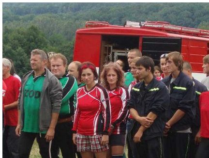
14. 7. Veselá: ženy – 3. místo