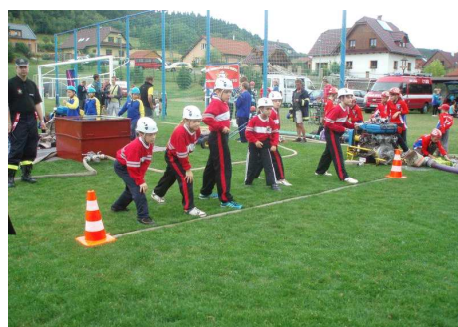
25. 8. Viganticce: mladší a starší – 3. a 8. místo