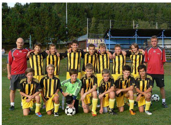
Starší žáci – podzim 2012