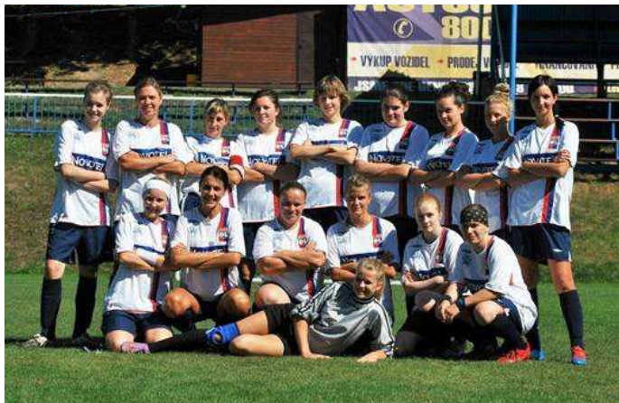
Ženy – podzim 2012

Tímto bych chtěl poděkovat všem sponzorům a činovníkům, kteří řídí chod našeho malého fotbalového klubu a samozřejmě pozvat všechny občany na naše domácí utkání.