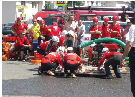
5. 7. Horní Bečva: ženy – 10. místo