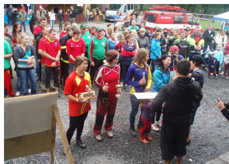
1. 9. Prostřední Bečva: ženy – 2. místo