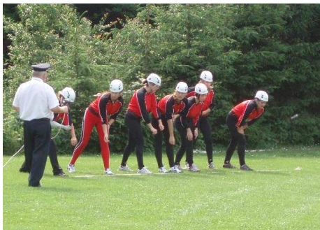
23. 6. Valašská Bystřice: ženy – 4. místo